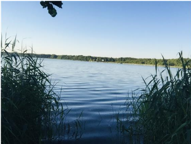
Impressionen von der Eigentümerin