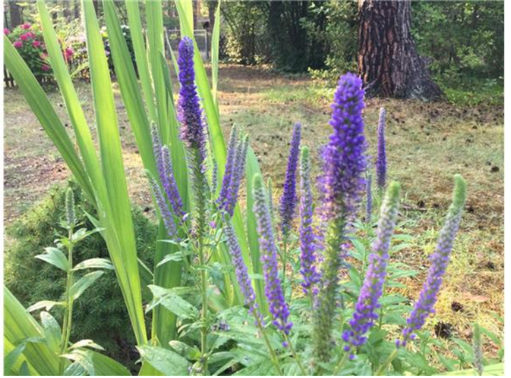
Impressionen von der Eigentümerin 6