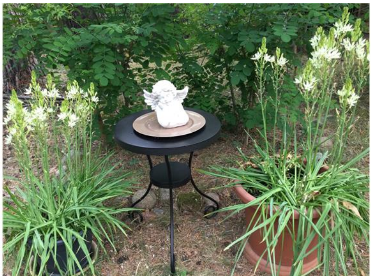
Impressionen von der Eigentümerin 4