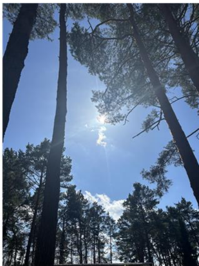
Impressionen von der Eigentümerin 3