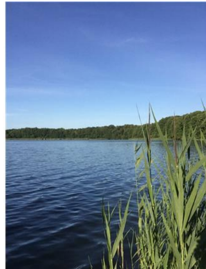
Impressionen von der Eigentümerin 2