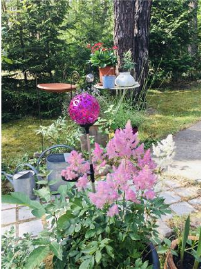
Impressionen von der Eigentümerin 5